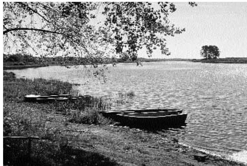
Salaca lejpus iztekas no Burtņieku ezera. Tālumā pa labi – Riņņukalniņš 1998. gada foto

88,0 Ass Salacas likums pa labi, tad slaidis pagrieziena pa kreisi – Ridēnu pagrieziena. Tā galā, upes labajā krastā atradās Ores mājas (E 27) , kur dzimis komponists Ādams Ore (1855–1927). Saglabājušās ir tikai liepas. Slavenais ērģelnieks savulaik koncertējis Krievijā, Austrijā, Šveicē, Vācijā. Pie upes, tās labajā krastā pienāk Sēļu – Mazsalacas ceļš. Pa šo ceļu 2,5 km Sēļu virzienā ceļa kreisajā pusē atrodas vecu vējdzirnavu atliekas. To īpašnieks bija vācietis, kurš 1939. gadā pameta savu īpašumu un aizbrauca. Dzirnavas darbojās vēl 50. gados. No tām saglabājušās tikai mūra sienas. 0,5 km tālāk atrodas Tūteres svētozola vieta (E 28) . Tūteres ozols bija viens no pēdējiem senču upurozoliem, tāpēc vietējie mācītāji centušies iznīcināt šo koku. 1781. gada vasarā mācītājs Gustavs Bergmanis vairākas dienas pats mēģinājis to nocirst. Par ozolu saglabājušās vairākas teikas un nostāsti. Teika [12, 466. lpp.] stāsta, ka ozolu no zīles iestādījis kāds ganuzēns, un tas audzis no gadiem, bet stundām. Pēc citas teikas [7, 368. lpp.] ozols izaudzis no