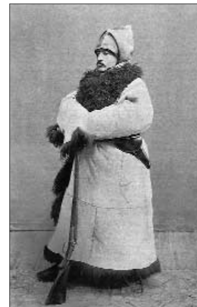
Svens Hedins pirmā Centrālāzijas ceļojuma laikā. 1894./95. gada ziemā viņš šķērsoja Augsto Pamiru un sasniedza Kašgaru. Visos ceļojumos viņu pavadīja divi neiztrūkstoši ekipējuma priekšmeti: zviedru armijas revolveris un Bibele

Karavānu veidoja četri vietējie pavadoņi – viens teicās labi pārzināms tuksnesi – astoņi kamieļi, divi sargsuņi un savdabīga «dzīvā gaļas noliktava», kurā ietilpa trīs aitas, desmit vistas un viens gailis. 1895. gada