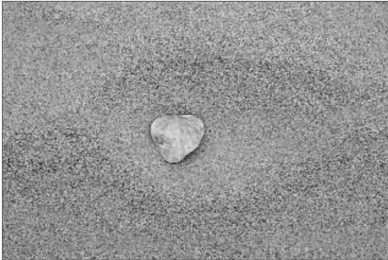
Pirmā savvaļas papeles lapa, ko vējš bija atnesis šurp no Hotandarjas, deva mums jaunas cerības drīzumā sasniegt veģetācijas zonas robežu