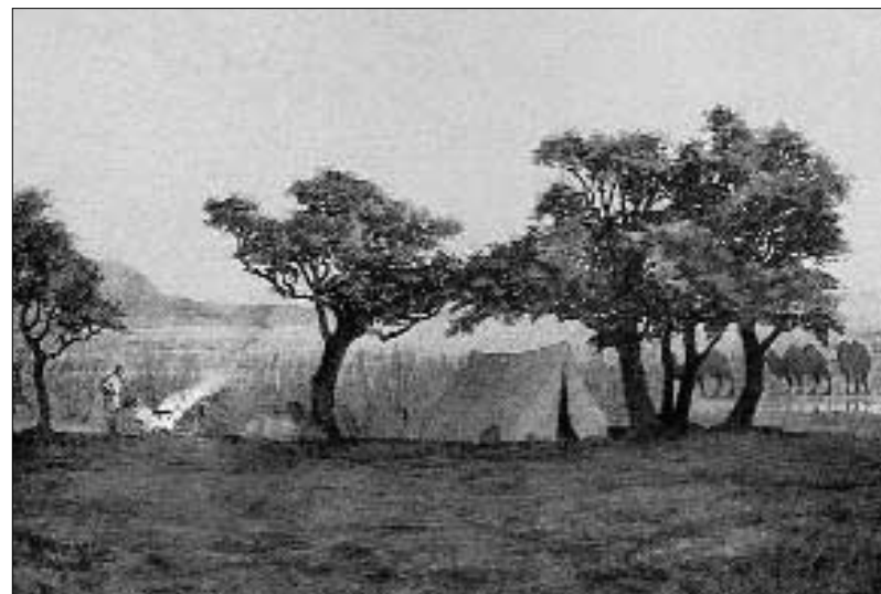
Hedina karavāna ierikoja nometni tograku, savvaļas papeļu, ēnā un vienu dienu atpūtas pašā ezera krastā

Nākamās dienas vakarā viņi sasniedza kalnu pakāji un turpināja ceļu gar grēdas ziemeļmalu. Līdzīgi izplestas plaukstas pirkštiem grē-