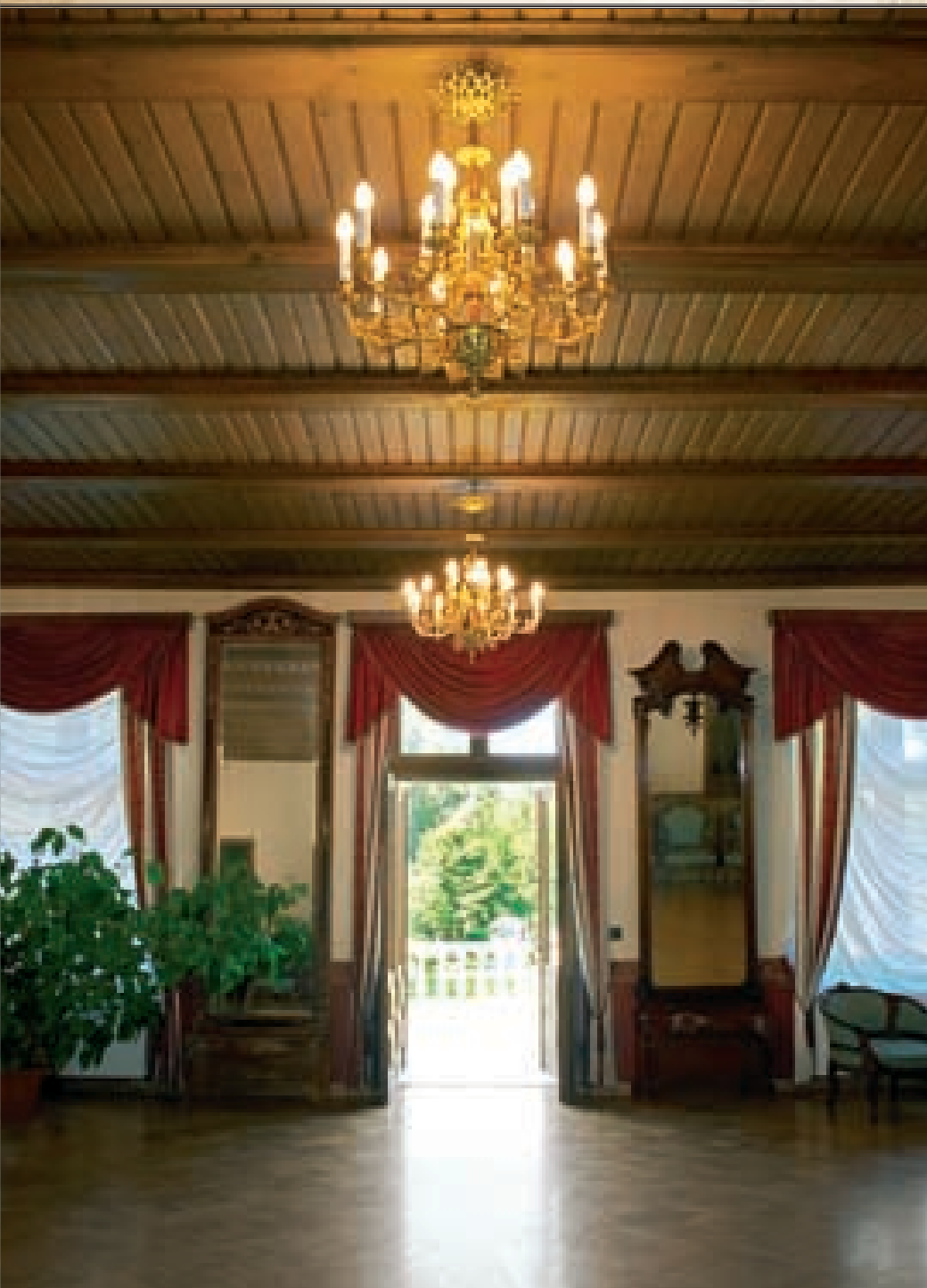
37. att. No Dāmu salona iespējams iziet uz otrā stāva terases, no kuras paveras brīnišķīgs skats uz parku un tuvējām muižas ēkām